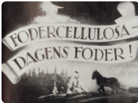
Under krigsåren på 1940-talet ströps importen av kraftfoder. Flera svenska massabruk kompletterade produktionen med fodercellulosa – och SoL-film hjälpte till med marknadsföringen.

Trots ett mycket ljumt intresse kunde Skogsvårdsstyrelsernas Filmförening bildas den 24 mars 1924, alltså för nästan exakt 90 år sedan.