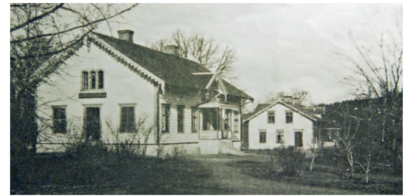
Starten för Ombergs skogsskola var motig. Redan 1863 brann den första byggnaden. Nästa byggnad stod till 1921 då också den brann – och återuppfördes. År 1934 togs skolepoken slut och här blev istället kontor för Domänverket.

Inledningen på kapitlet Högskogsbehandling av gran. ”Rena granskogar behandlas dels genom kalhyggen, dels besäningshyggen och dels kittelhyggen. Kalhyggen är den lämpligaste afverkningsmetoden i rena granskogar. Då denna method användes, måste antingen hygget besås ur hand, eller planteras, eller och hvartannat hygge lemnas quarstående, för att befröa de kala mellanliggande hyggena. Af dessa olika sätt att befördra återväxt, är planteringen det säkraste. För att kunna verkställa plantering, måste plantskola anläggas 1/80 å 1/120:e del af den areal som ska planteras. Till plantskolan tages en jemn någorlunda stenfri mark i skydd af ståndskog från söder och vester.”