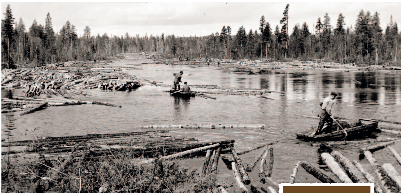
Tyvär finns inga uppgifter om när eller var bilden är tagen.