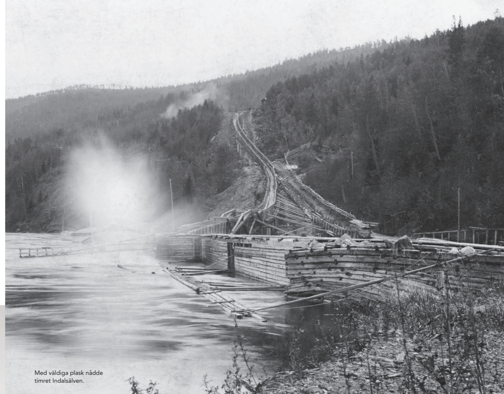
Med väldiga plask nådde timret Indalsälven.

KULTURMINNET Gudmundstjärn har idag 23 bevarade byggnader. De ligger på sina ursprungliga platser och omges av ett naturreservat bestående av skog, åkrar och ängar. Skötseln av området skall efterlikna den ursprungliga under självhushållets dagar. ●