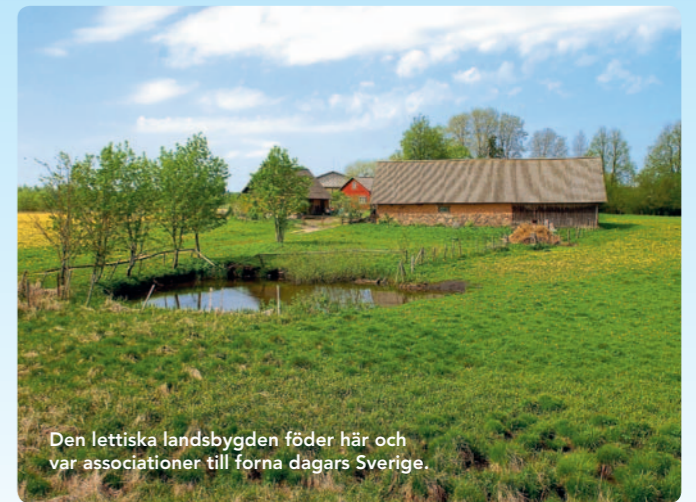
Den lettiska landsbygden föder här och var associationer till forna dagars Sverige.