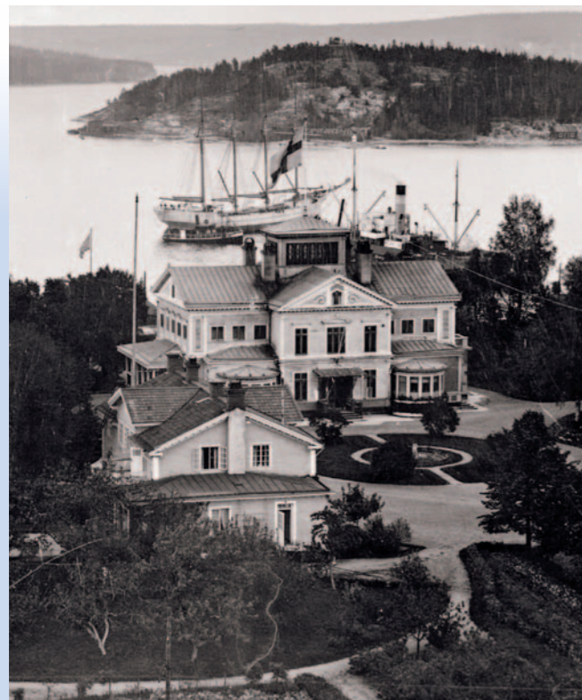
Sågverksägarna byggde oftast sina herrgårdar med utsikt över både det sågverk och det samhälle de härskade över. Kubikensborg 1906.

Det finns en rik flora av skildringar i den svenska litteraturen som ur olika perspektiv speglar livet och människorna som var knutna till sågverken. Här är två av dem.