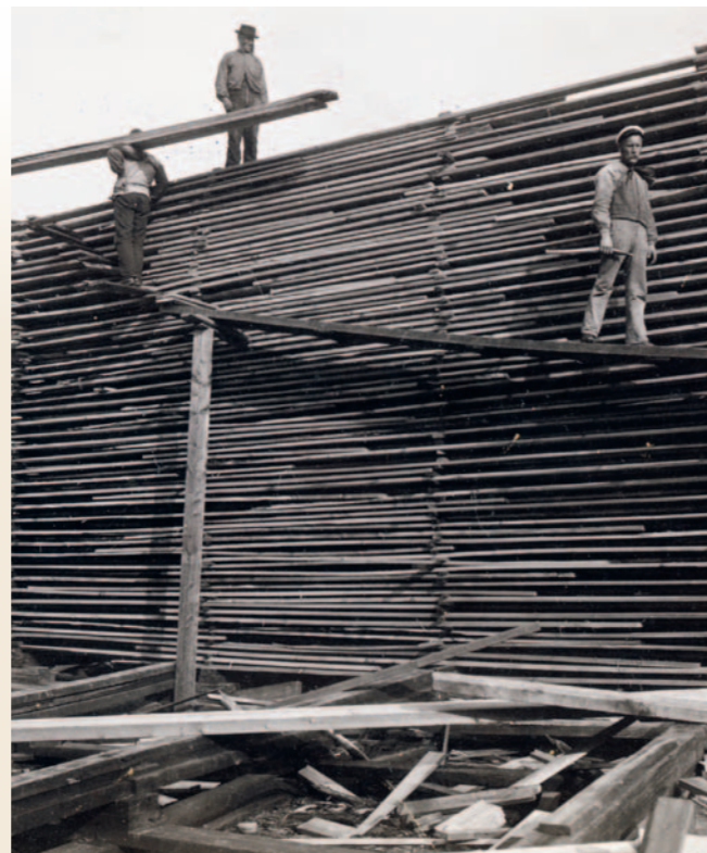
Kombinationen av tunga plankor, hårda vindkast och smala, ofta hala spänger gjorde stabbläggning till ett farligt arbete. Wifstavarf 1905.

I MITTEN AV SEPTEMBER år 1894 samlades allt vad Öbackaälven hade av pampiga sågverksgubbar i traktens mest ansedda herrgård, Västanå herrgård. Där aväts en rejäl middag, med stark och god mat, följd av punsch och toddy och havannacigarer. I cigarernas rök lägger middagens initiativtagare, grosshandlare Lutherholm, fram sin stora plan för traktens sågverksindustri. Ett nytt sågverksdistrikt skall anläggas i Öbackas närhet och kombineras med massatillverkning. Sågverksägarna är till en början djupt skeptiska till Lutherholms ideer: