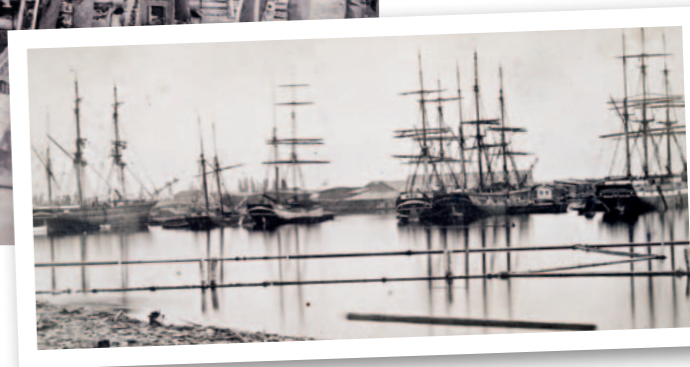
Den snabba industrialiseringen i Europa vid 1800-talets mitt skapade ett omätligt behov av trävaror. Sedan det norska Sörlandet tömts på virke vändes blickarna först mot Västsverige och snart mot Norrlands oexploaterade skogar. Lastande segelfartyg vid Wifstavarf 1870.