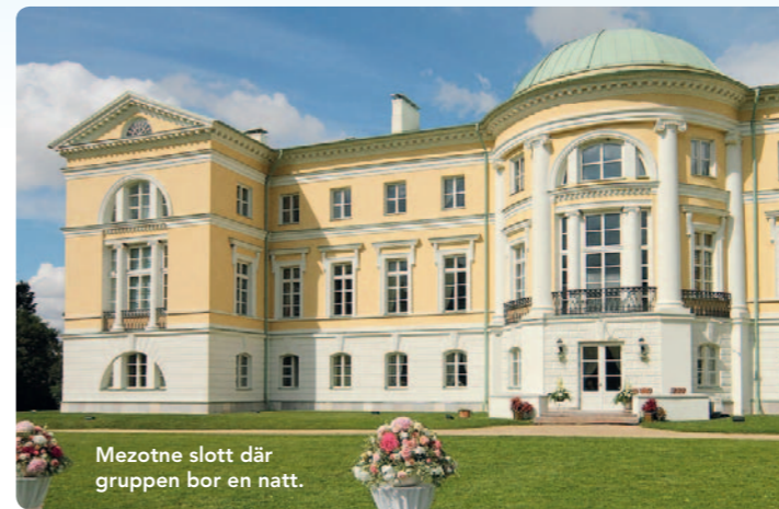
Mezotne slott där gruppen bor en natt.