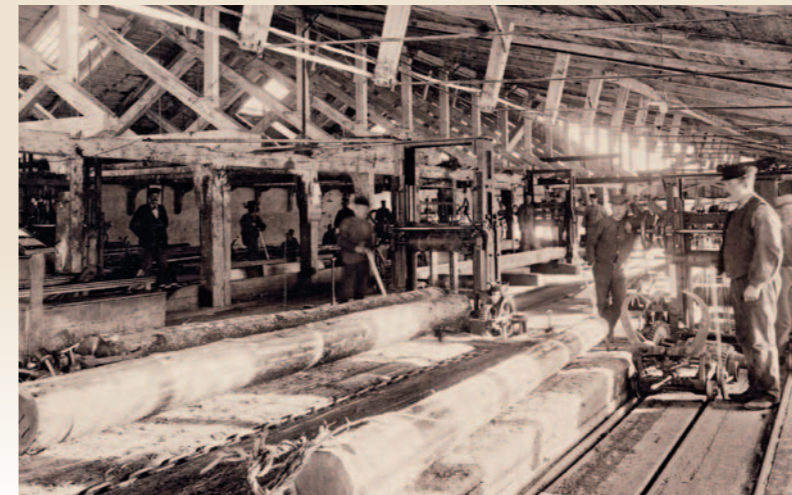
Kubikensborgs sågverk före ombyggnaden 1907.

”När Sundsvallsdistriktet under andra halvan av 1800-talet växte fram till att bli ett sågverkscentrum med till slut närmare ett 40-tal stora sågverk i drift vid Ljungans och Indalsälvens mynningar sjöng fortfarande lärkorna över ett skoglöst Hallands ljunghedar. Idag finns endast ett storsågverk kvar i Sundsvallsområdet medan ett numera skogrikt Halland förser några av landets största sågverk med råvara.”