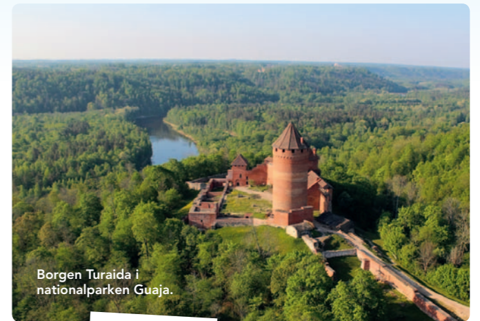
Borgen Turaida i nationalparken Guaja.