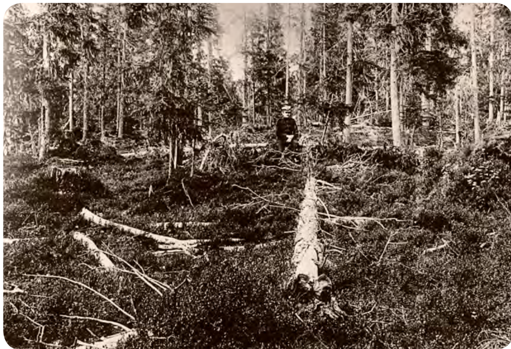
En sorgsen revirförvaltare mediterar över den rovbyggna skogens framtid.

skogen för att stämpla och ”pricka” allt. Sägverksbolagen nere vid kusten hade vädrat billigt virke och mobiliserat allt folk man fick tag i. Drivningskostnaderna och riskerna för folk blev dock höga.