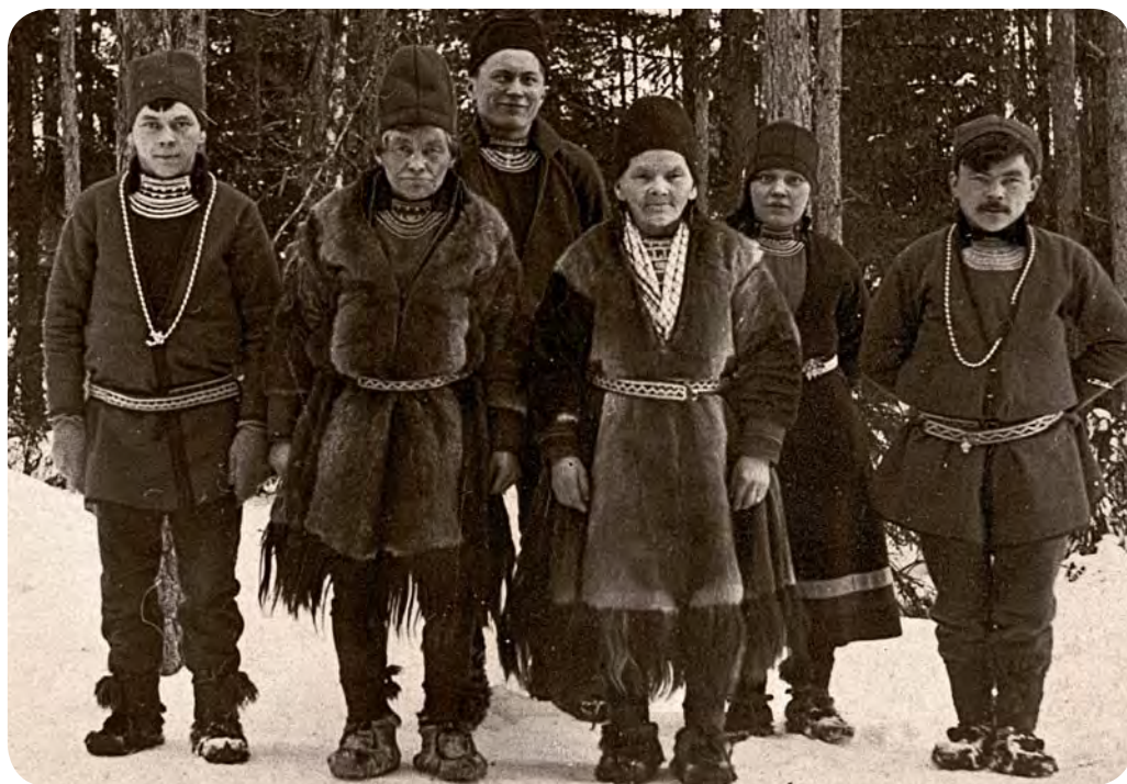
På jägmästarns gård började alltid "stormarknan" på samma sätt: Åtta samer stod plötsligt i köket. De slängde en säck med frusen sik på golvet. Här samefamilj från Borgafjällen.

På några timmar hade regnet avtagit. Åtminstone den äldre följeslagaren menade att de här lapparna räddat hans liv. Tacksamma kunde de fortsätta ner mot Kvikkjokk.