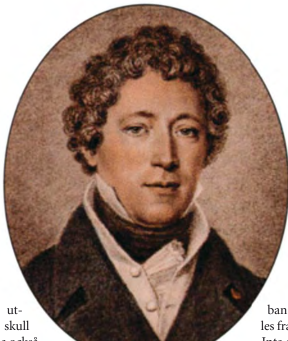
Israel Adolf af Ström, 1778 – 1856

skulle förgiftad åtel utläggas. För säkerhets skull måste de bägge jägarna också redan denna natt tända eldar vid Kaknäs, Tegeludden och