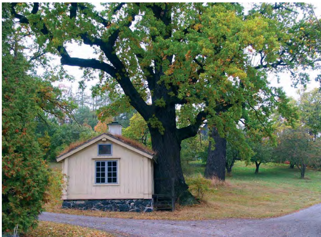
Karl XI kunde också koppla av med fiske. Här hans eget Fiskartorpet, idag parkens äldsta byggnad. Som bekant också besjungen av Bellman.