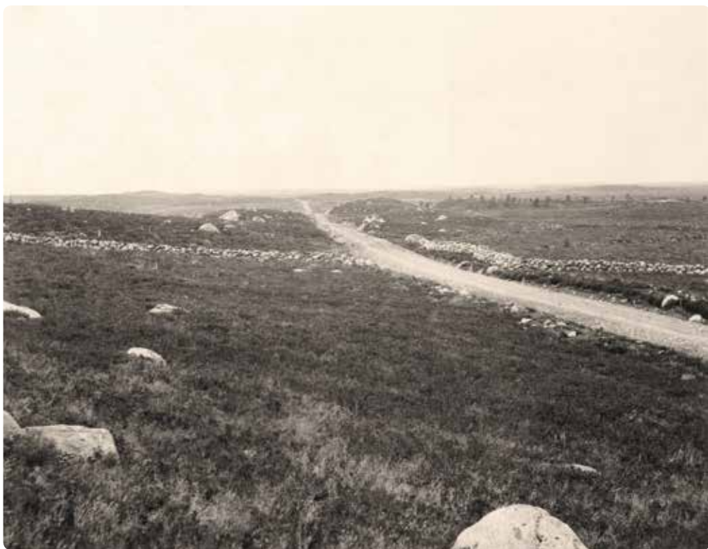
Vy över Ljungheden i Vrå sockens västra delar 1923. Vägen bröts som nödhjälpsarbete åren 1919–1920.