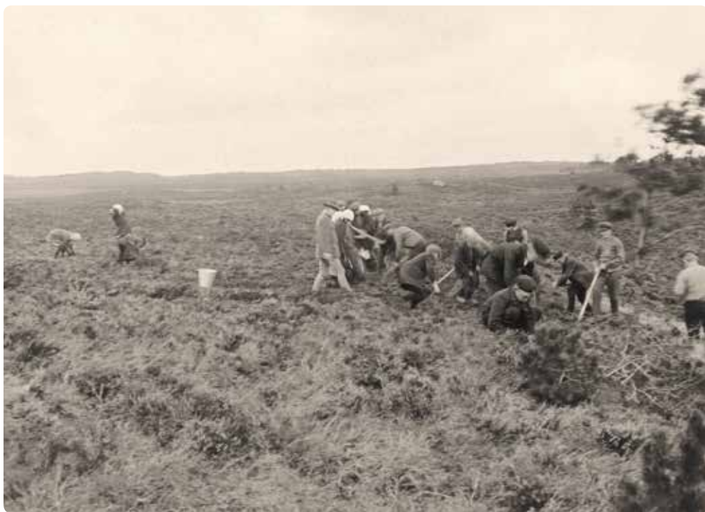
Första planteringslaget i färd med att beskoga ljungheden vid Härsängen, maj 1915.