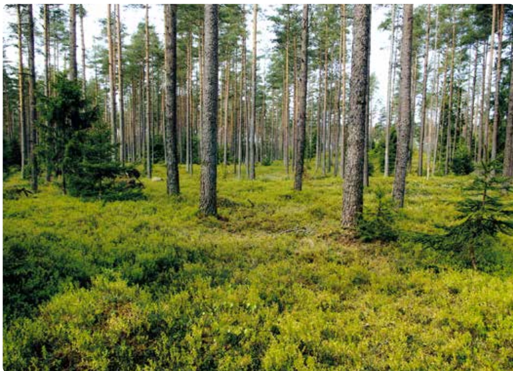
Tall var ett självklart förstahandsalternativ vid ljunghedsplantering. Idag smyger sig granen in. Singeshult 2011.