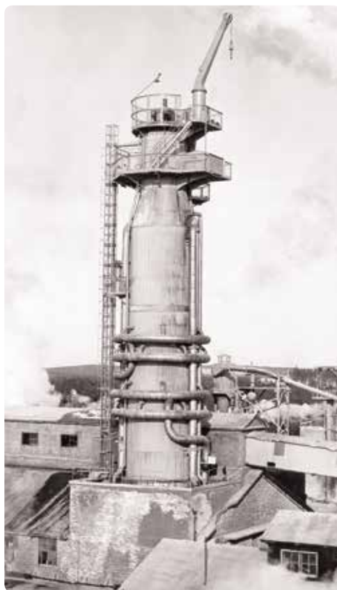
Runt 1960 hade utvecklingen av kontinuerliga sulfatkokare, kommit så långt att det var sådana som installerades vid om- och nybyggnader. Istället för satsvis kokning matades flis och kokväska in uppfån i ett jämnt flöde.

EN ANNAN GENOMGRIPANDE EFFEKT av den nämnda tekniska utvecklingen var det som