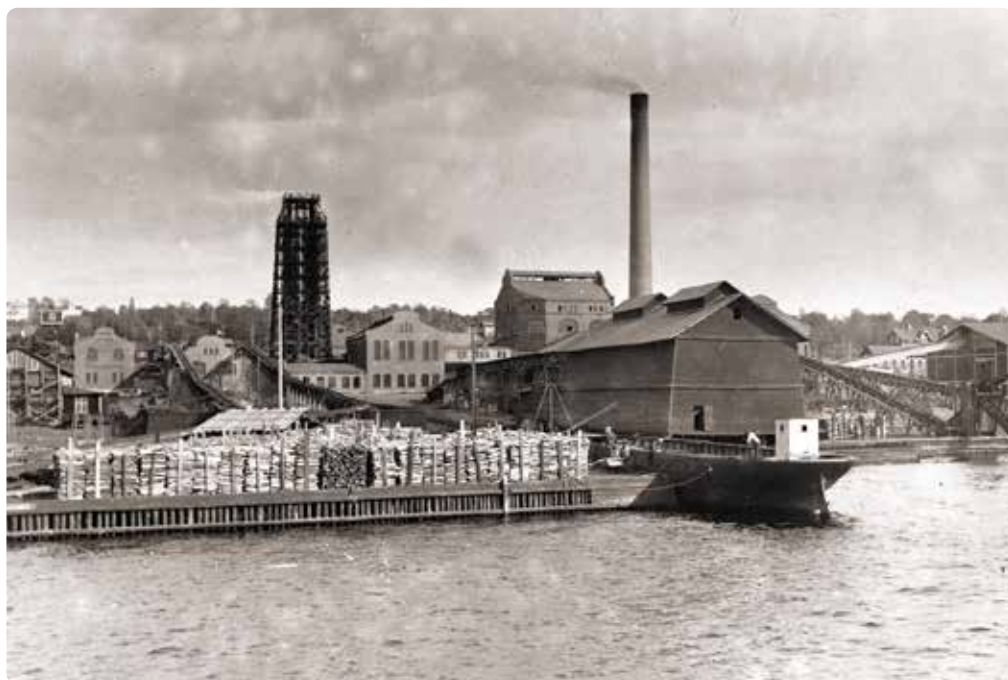
Den klassiska silhuetten av en sulfitfabrik, dominerad av syratornet. De torn i trä som uppfördes under nybyggnadsperioden, ersattes från slutet av 1920-talet vid de allra flesta fabriker av gjutna betongtorn. På bilden, som togs 1916 i Söråker vid Indalsälvens utlopp, finns trätorntet fortfarande kvar. I förgrunden pågår vedlossning från prämen "Söråker" (f.d. kanonbåten "Motala").

kallade "trähaltiga" tryckpapper, om man satte till ca 20 procent sulfitmassa som armeringsfibrer. (Slipningen har numera ersatts av mera raffinerade metoder, som inte kräver någon tillsats av armeringsmassa.) Norrlands första sliperi – som kompletterades med en pappfabrik – togs i drift i början av 1869, vid Forsså bruk nära Hudiksvall. Under åren 1890 fram till första världskrigets början samt under 1920-talet anlades i Norrland totalt 25 sliperier, de flesta för avsalumassa. Vid andra världskrigets utbrott fanns 18 av dem kvar.