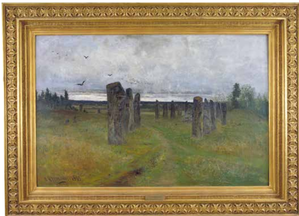
”Vad skulle man om ett århundrade gifva för en verklig bild av fosterlandet, sådant det fordom varit?” frågar sig Nordenskiöld 1880. Naturvårdens uppkomst motiverades i hög grad av önskan att bevara utvalda delar av en oförstörd landskapsbild innan skogs- och jordbruk förändrat allting. Åsa gravfält, Överselö, Södermanland. Tavla av Olof Hermelin 1885, deponerad på Statens Historiska museum. Foto Gabriel Hildebrand. Kulturmiljöbild RAÄ.

1931) skrev i en riksdagsmotion 1904 att riksdagen borde skriva till regeringen om att utreda vilka skyddsåtgärder som borde vidtas för landets natur och naturminnesmärken. En utredning tillsattes och i ett betänkande 1907 skrevs att områden borde kunna avsättas ”där naturlivet får utveckla sig alldeles ostört av inverkan från kulturen” 1 . Det handlade om ekonomiska, naturvetenskapliga, estetiska och kulturhistoriska motiv, det sistnämnda i form av ”naturföremål, vid hvilka sägner, historiska minnen eller folkliga plägseder äro fästade”. 2 Den statliga naturvården fick 1909 en formell grund att stå på i och med att riksdagen antog en naturskyddslag. Samtidigt inrättades de nio nationalparkerna Abisko, Garphyttan, Hamra, Pieljekaise, Sarek, Stora Sjöfallet, Sånfjället,