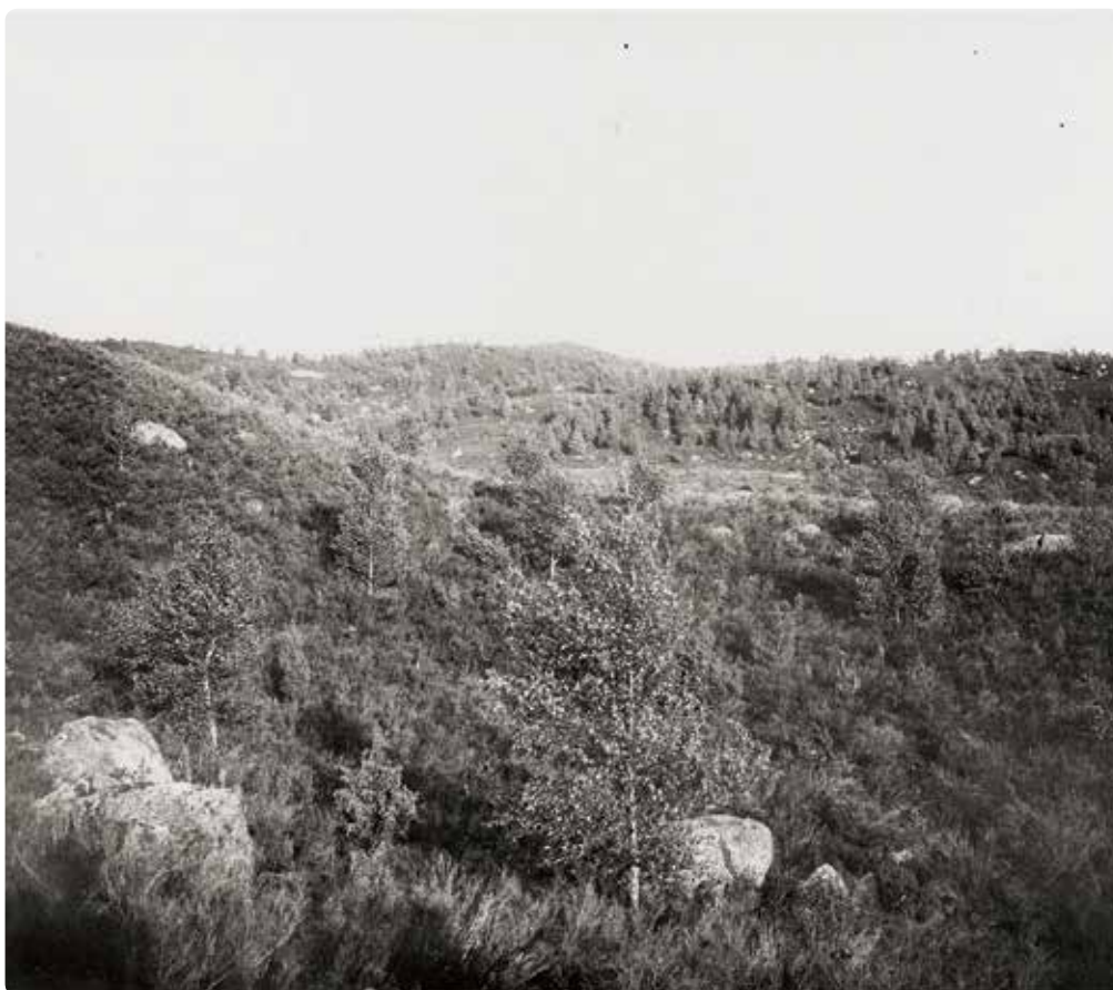
Ljunghedar av det här slaget fanns det gott om i sydvästra Kronoberg vid förra seklets början.

Därför föreslog han att så kallade ” moderbestånd ” skulle anläggas i rektangulära ytor jämnt fördelade över ryarna på cirka tio procent av arealen. De skulle vara ungefär ett halvt hektar stora. På sikt skulle härigenom frön efterhand spridas över hela arealen.