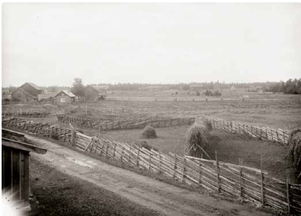
Sverige var vid förra seklet ett gärdesgårdarnas land. Behovet av "hank och stör" gick hårt åt ungskogarna och vid Skogsvårdsstyrelsen i Kronoberg diskuterade man mer virkesbesparande metoder. Bilden togs på 1920-talet i Hållnäs, Uppland.

som borde gallras bort "erfordrades forstligt omdöme" – därför borde Skogsvårdsstyrelsen hjälpa skogsägarna med detta.