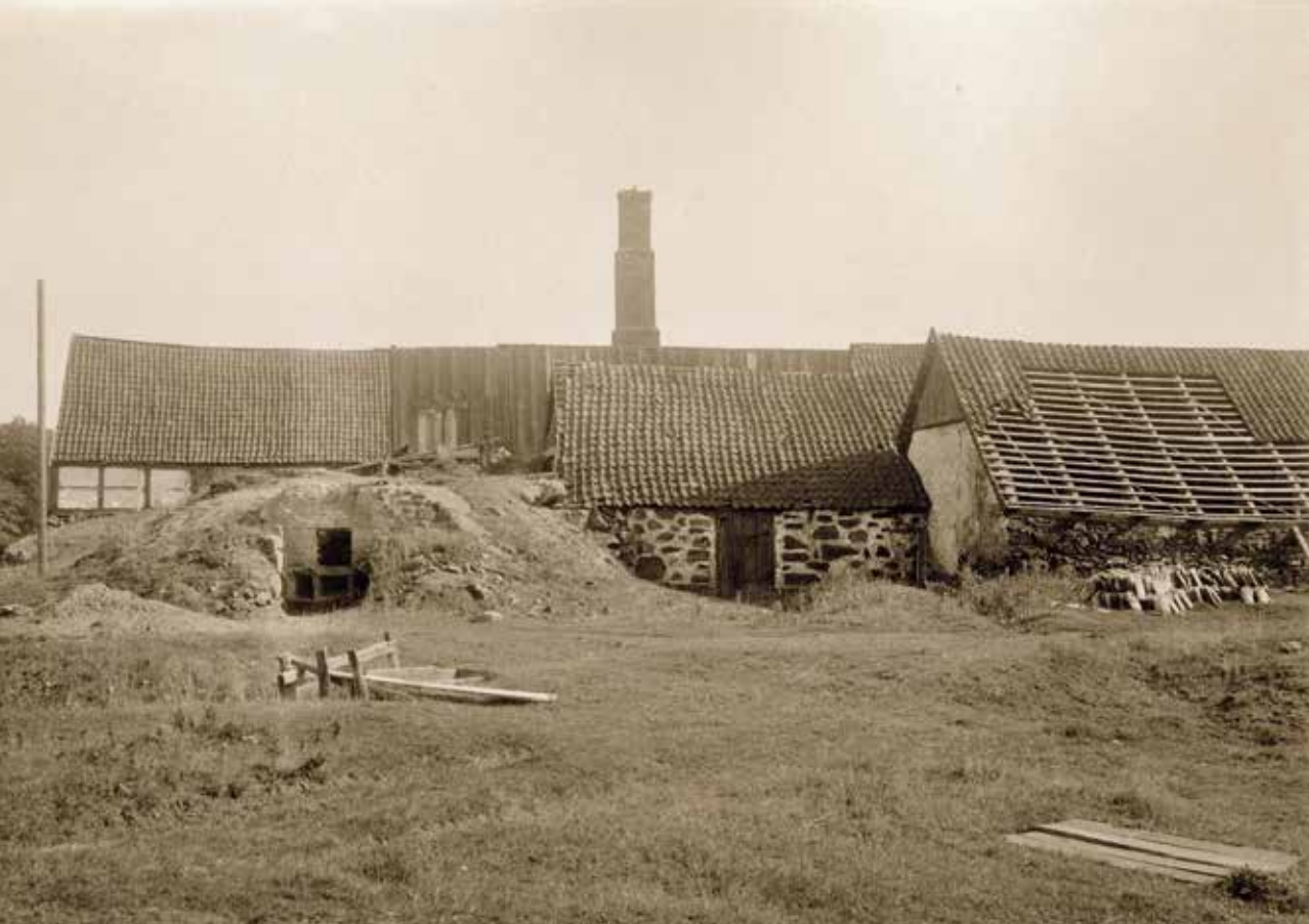
Pannhuset, luthuset och karhuset där slutbehandlingen av alunluten ägde rum och den kristalliserades till alun. Bilden togs i början av 1900-talet. Tekniska museet.