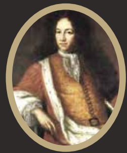
Carl Piper hade en inflytelserik position som riksråd och stod både Karl XI och Karl XII nära. Sedan han följt den senare på krigståg ute i Europa år 1700 återkom han aldrig till Sverige. Målning av David Kock.

Verkalinjen. Inom detta väldiga område var all skog reserverad för alunbrukets i Andrarum behov. Behövde en bonde virke för att bygga hus av var han tvungen att ansöka om det hos Bergstingsrätten. Landsbefolkningen fick inte ens låta sina kreatur beta i skogen.