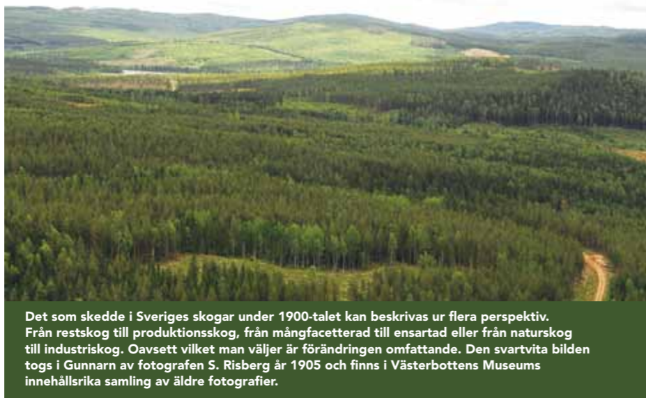
Det som skedde i Sveriges skogar under 1900-talet kan beskrivas ur flera perspektiv. Från restskog till produktionsskog, från mångfacetterad till ensartad eller från naturskog till industriskog. Oavsett vilket man väljer är förändringen omfattande. Den svartvita bilden togs i Gunnarn av fotografen S. Risberg år 1905 och finns i Västerbottens Museums innehållsrika samling av äldre fotografier.

het i allt mer tätbefolkade bygder. Ända in på 1940-talet fortsatte antalet småbruk att växa i vissa delar av landet.