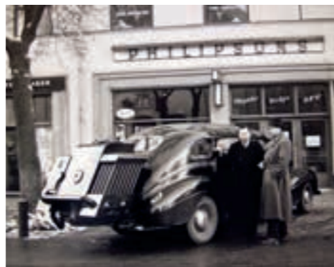
En tjugusig bil krävde förstås också ett matchande gengasaggregat. Bilden togs 1940 utanför Philipssons i Karlstad.

Det verkligt stora problemet med gengas, är just dess innehåll av kolmonoxid. Det är en gas som är starkt giftig. Vid inandning i stora doser förhindrar den syreupptagningen i blodet. Att kolmonoxid dessutom är både smak- och luktlös gör den extra lömsk. Under krigsåren inträffade ett stort antal olyckor med gengas. Bara under