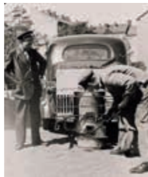
Precis som vilken eldstad som helst måste gengasaggregaten slaggas ur och sotas med regelbundna mellanrum.

1941 dog tolv människor av kolmonoxidförgiftning, flera hundra skadades livshotande och ett tusental fick mindre allvarliga skador. Det farligaste momentet var när man just hade tänt gengaspannan. Det tog en stund innan den levererade tillräckligt med gas för att motorn skulle kunna startas. Om detta skedde i ett dåligt ventilerat garage var risken att bli förgiftad överhängande. Rekommendationen i sådana fall var att starta bilen med en skvätt bensin så att man kunde köra ut ur garaget och invänta att pannan skulle generera tillräcklig mängd gengas.