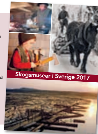
Skogsmuseer i Sverige 2017

Sedan starten 2013 har Museinätverket Skog & Trä samlat allt fler medlemmar. Nu senast på tillkom Lantbruksmuseet Ljusfallshammar i norra Östergötland. Att på det här sättet slå sig samman i ett nätverk gör att museerna kan dra nytta av varandra. Det ger dem en starkare röst i deras strävan att hålla Sveriges skogshistoriska arv levande. Museerna presenterar sig på den gemensamma webbsidan skogshistoria.se och i en årlig folder som kan beställas från Skogsmuseet i Lycksele: skogsmuseet.se