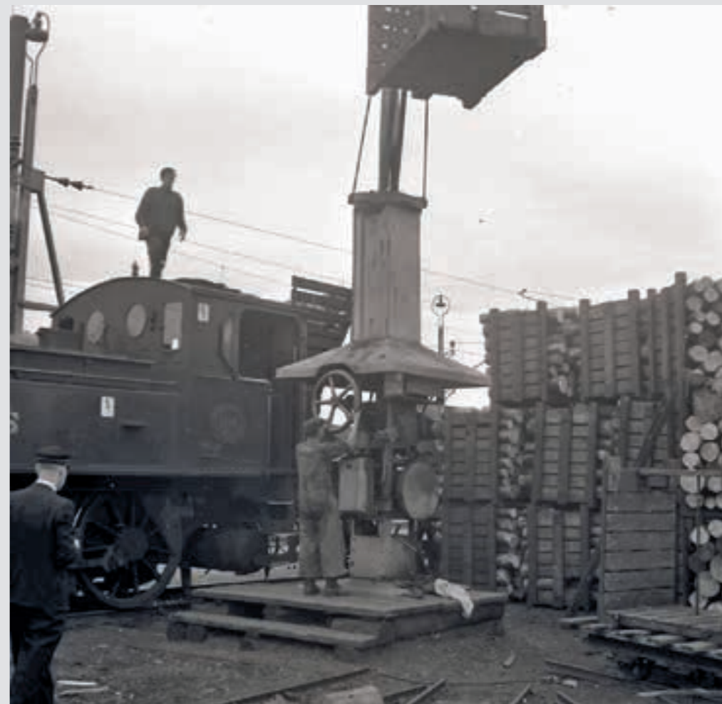
Utan möjligheterna att ställa om loken till vedeldning hade läget för de svenska järnvägarna blivit prekärt under krigsåren.