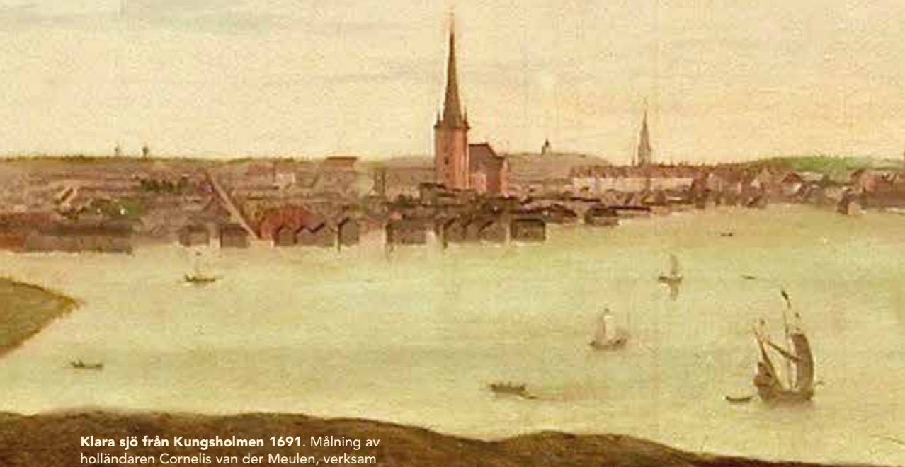
Klara sjö från Kungsholmen 1691. Målning av holländaren Cornelis van der Meulen, verksam i Sverige från slutet av 1670-talet. Målningen är beskuren på båda sidorna. Wikiwand.