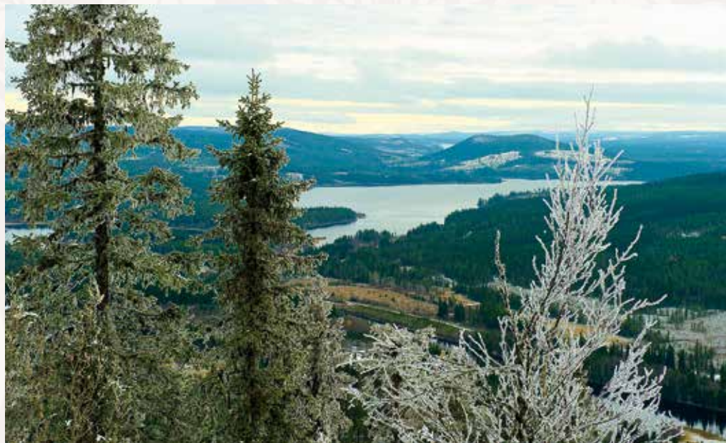
Här slog de sig ned. Lilla Stalonberget ned mot Malgomaj.