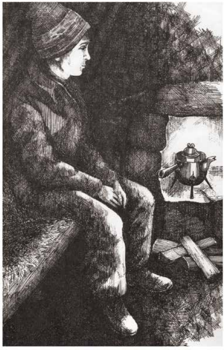
Illustration ur Bert Olls bok Kolaren

"Ack Gud, där är ett, där är två – i sitt garn de mig ta – se hur granna de svinga! De vinka – Gud trösta mig, fattiga barn! Här gäller för livet att springa. Det är så mörkt långt, långt bort i skogen.