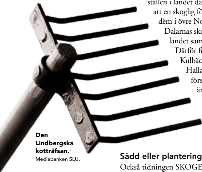
Den Lindbergska kotträfsan.

försöksytor som etablerades för 100 år sedan följs än idag och arvet att förvalta dessa ytor och de äldre försöksparkerna har övertagits av Sveriges lantbruksuniversitet (SLU). Under senare tid har även några ytterligare försöksparker etablerats för att representera skogliga förhållanden som de äldre parkerna inte uppfyllde.