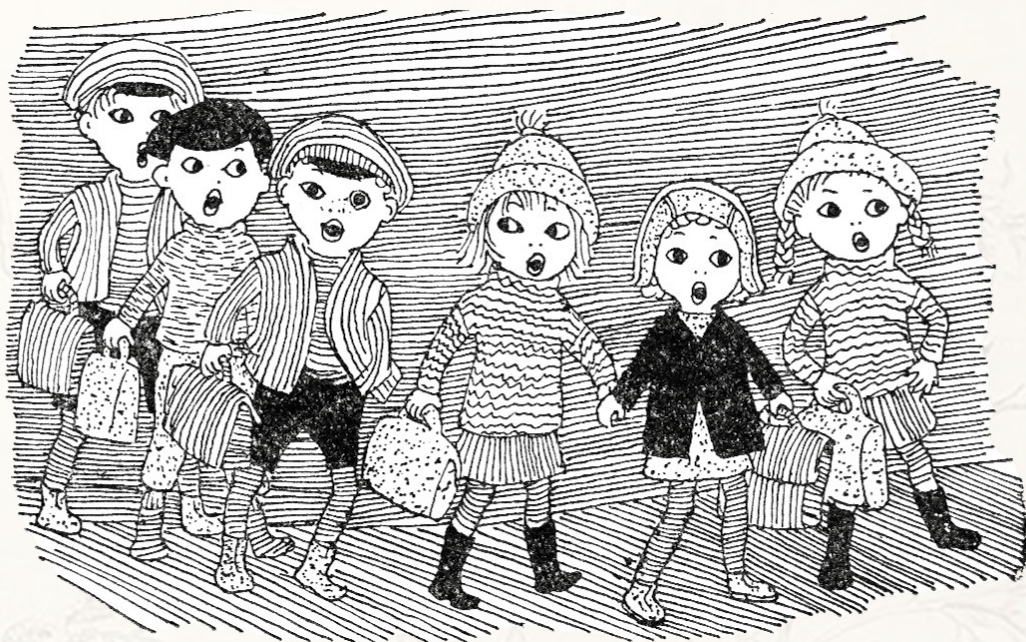
Bullerbybarnen brukade sjunga när de gick genom skogen till och från skolan i vintermörkret: Illustration: Ilon Wikland