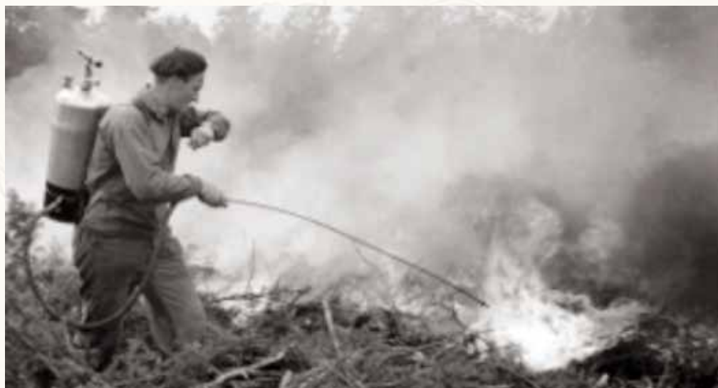
Gustave Doré kunde ha skapat en praktfull bild av när Pettersson i Hugnaden startade hyggesbränningen och solstrålarna bröt igenom röken på det där säregna bibliska viset.

På en hyggesbränning vandrar elden utifrån och inåt. Den bränner upp det som ska förbrännas, rättfram och utan förbarmande, men om brandgatan är välgjord och tillräckligt bred, då rör den aldrig vid världen därutån. Man börjar vid den högst belägna punkten, sedan går man långsamt längs brandgatan med sin eldapparat och sprutar elden in på hygget.