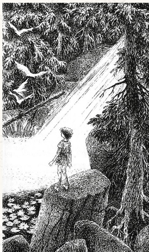
Skogen var full av hemligheter och trolldom men Ronja var inte rädd. Illustration: Ilon Wikland