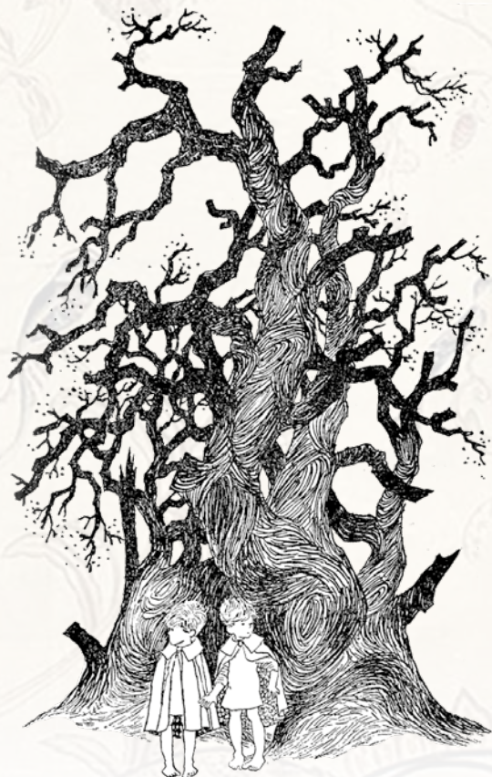
Mio och Jum-Jum höll varandra hårt i handen när de gick genom Döda skogen på väg till den ondskefulle Riddar Kato. Illustration: Ilon Wikland