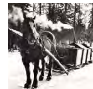
Med hjälp av sådana här hästdragna vattulådor isade man spåren i forvägarna för att hästarna skulle orka bättre i uppförsluten. Det var ett föga avundsvärt arbete att fylla de stora lådorna med vatten i sträng kyla.

När alla block till slut var avverkade hade Orsa besparingskog skattats på uppskattningsvis mellan 3,5 och 4 miljoner kubikmeter virke. Att det en gång så fattiga Orsa därmed blev den rikaste kommunen i landet är en helt annan historia. Inte förrän 1933 behövde man åter börja betala kommunalskatt. ■