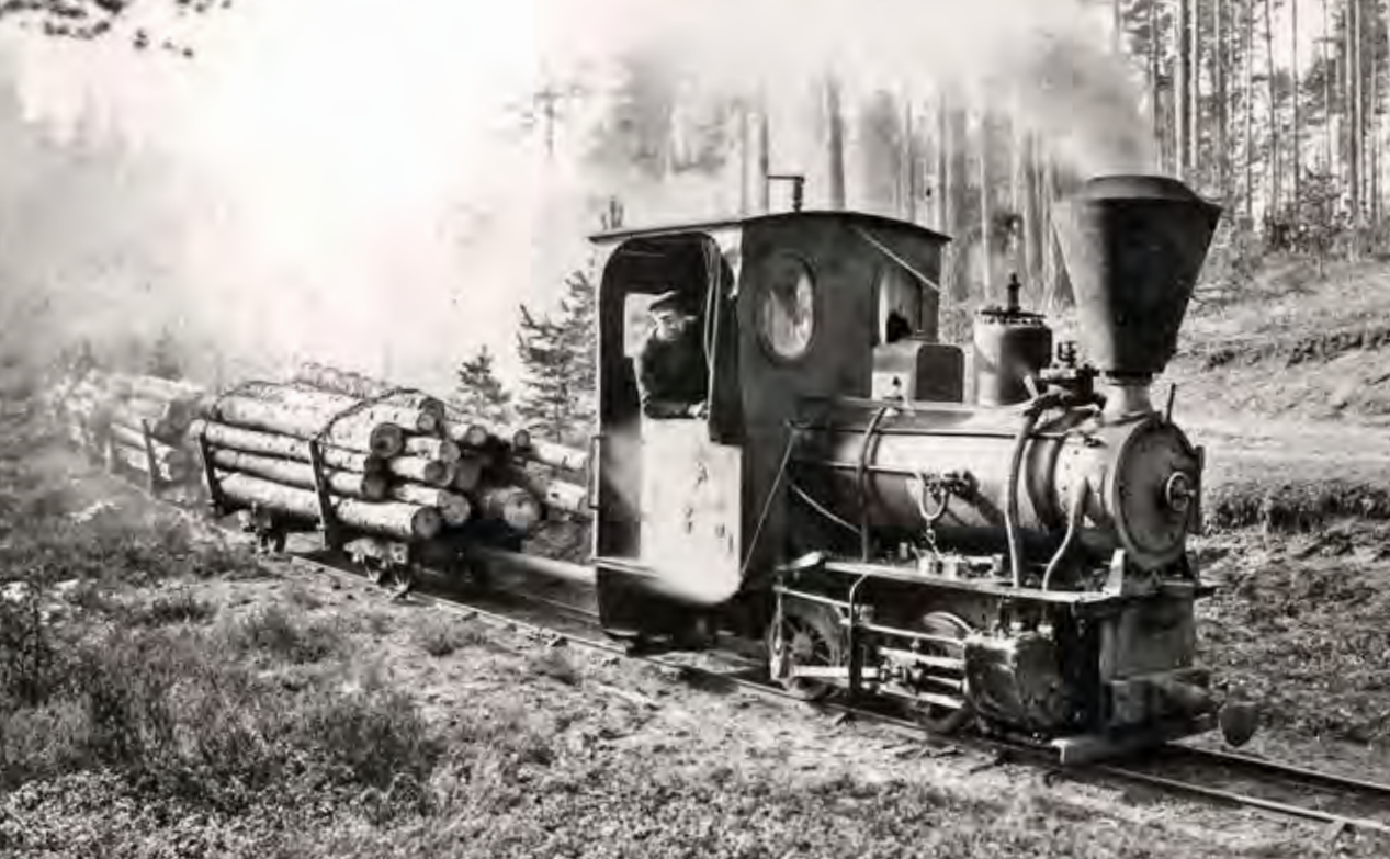
Loket Sot-Sara tuffar fram med virkeslastade vagnar i trakten av Gullringen.

Utdrag ur Skogshistoriska Sällskapets Årsskrift 2021, sid 6-13