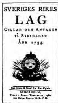
Domen år 1742 följde i allt väsentligt texten i 1734 års lag. Försättsblad från en år 1780 tryckt lagbok.

skäl kunde rätten inte undgå att till plikt fälla de flesta. Undantag gjordes för huskarlen Wulf som inte var tillstädes utan ”på landet” och ett antal personer som fick möjlighet att till nästa ting uppvisa ett påstått tillstånd.