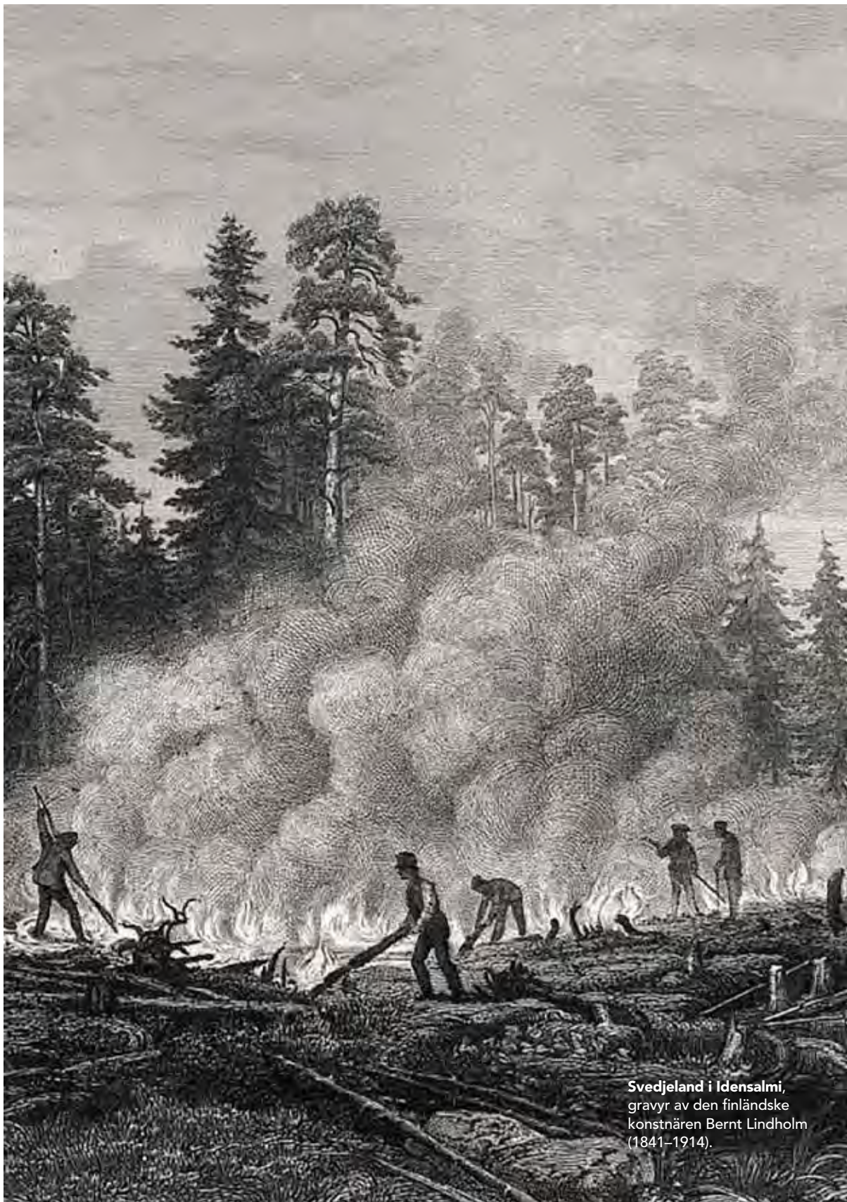
Svedjeländ i Idensalmi, gravyr av den finländske konstnären Bernt Lindholm (1841–1914).